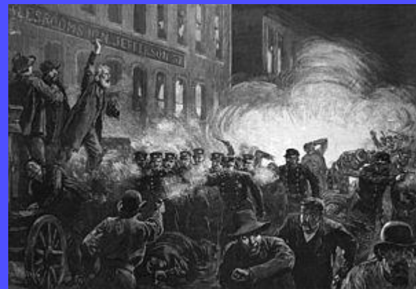
Delavski protesti; Chicago 1886