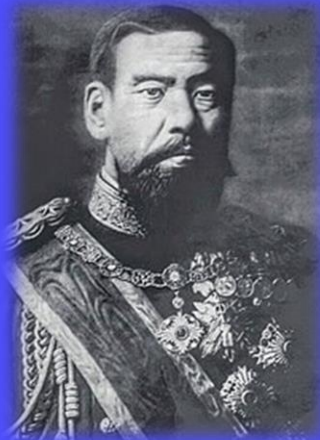
Japonski cesar Meiji Veliki (1867-1912)