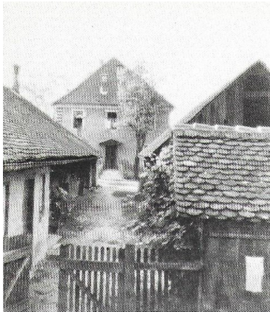
JAKOPIČEVA ROJSTNA HIŠA