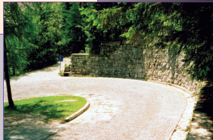
Za oskrbovanje svojih enot je avstrijska vojska zgradila prelaz čez Vršič (na sliki). Gradili so ga ruski vojni ujetniki.