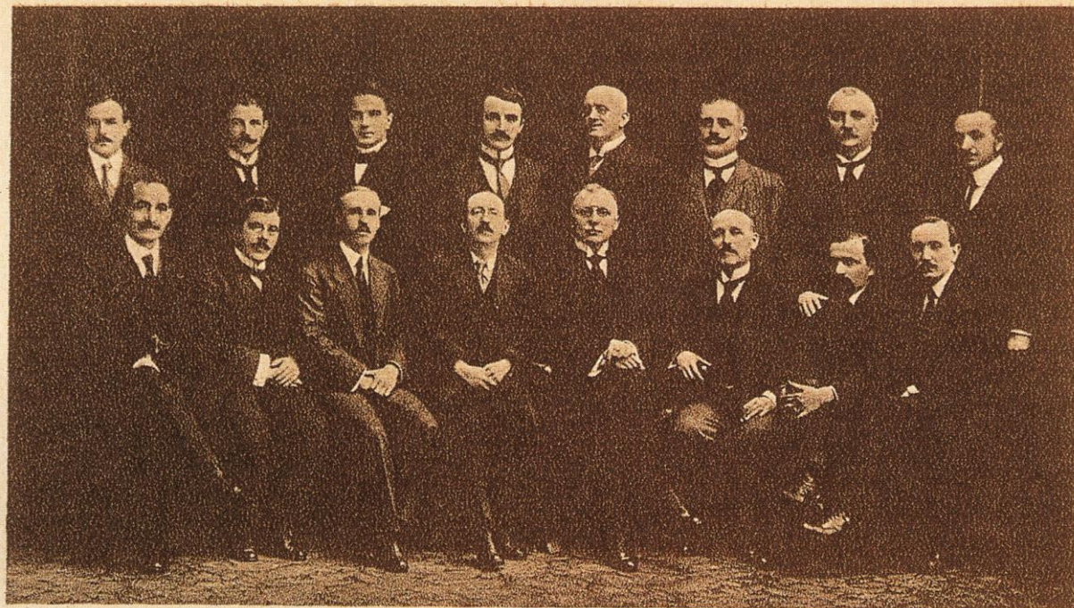
Člani jugoslovenskega odbora na seji v Parizu leta 1916.