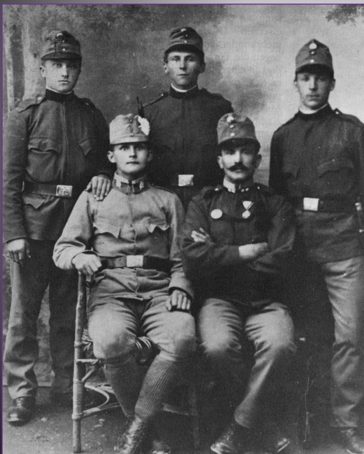
Pripadniki pehote, infanteristi.

(Tomaž Budkovič, Vojna in okolje, v: Soški protokol, Mohorjeva družba, Celovec, 1994)