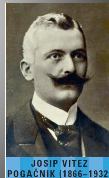
JOSIP VITEZ POGAČNIK (1866–1932)