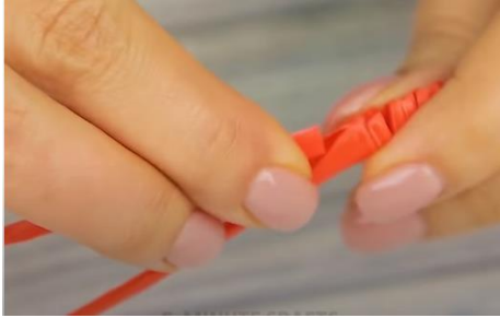
Slika 7 Vstavljanje enega konca slamice v drugega