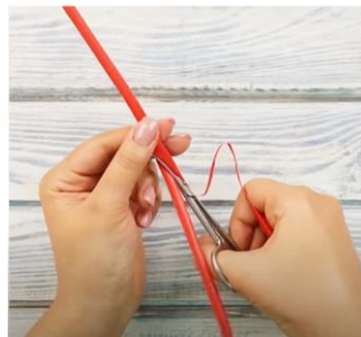
Slika 2 Rezanje v loku