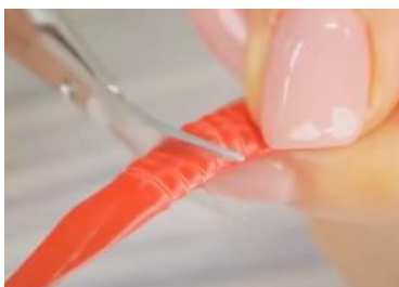
Slika 4 Zareze na prepogibih slamice