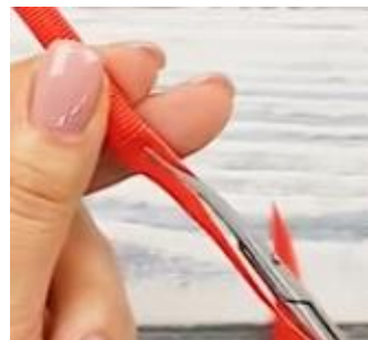
Slika 3 Zareza