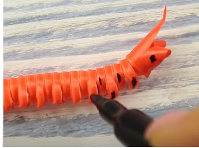
Slika 8 Risanje