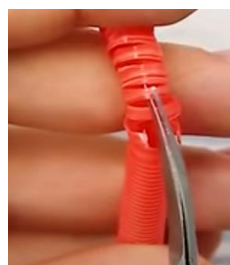
Slika 5 Vsako drugo zarezo prerežemo