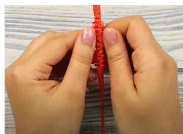
Slika 6 Poravnamo prerezane zarez