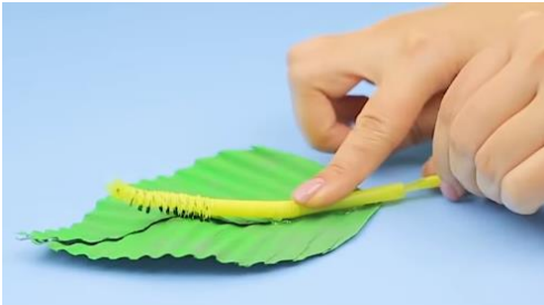
Slika 10 Premikanje vstavljene slamice naprej in nazaj – premikanje gosenice