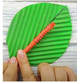
Slika 9 Lepljenje