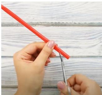
Slika 1 Začetek rezanja slamice

Slamica kot igračka – gosenica. Potrebuješ gibljivo slamico. Ravni del slamice v loku odrežeš (slika 1,2). Narediš zarezo (slika 3). Gibljivi del raztegneš in narediš zareze na prepogibih nekje do polovice gibljivega dela slamice (slika 4). Vsako drugo zarezo prestrižeš (slika 5) in nato jih še s prsti poravnáš (slika 6). Zadnji del slamice do konca in še dlje vstaviš v gibljivi del slamice (slika 7). Gosenici narišeš oči in noge (slika 8) in jo prilepiš na izrezan list (slika 9). Nato gosenico premikaš tako, da izvlečeš in potiskaš tisti del slamice, ki si jo vstavil do konca v drugi del slamice (slika 10, 11, 12).