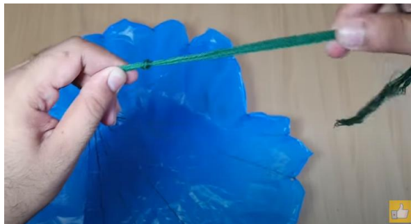
Slika 15 Skupen vozel na koncu vrvic