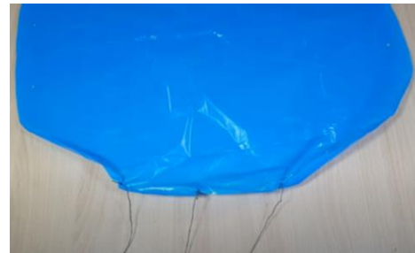
Slika 13 V luknje vstavimo vrvice in zavežemo