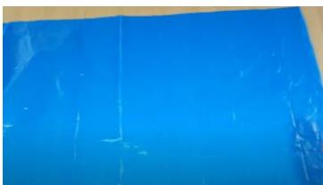
Slika 1 Razgrnjena in razrezana vrečka