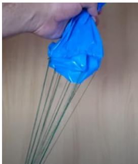
Slika 14 Vse vrvice so pritrjen