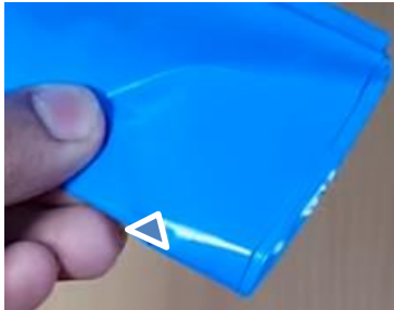
Slika 11 Izrežemo trikotnik