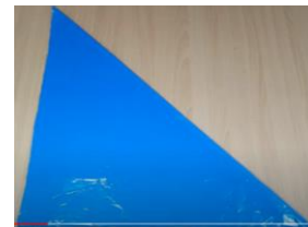
Slika 3 Odrezana vrečka