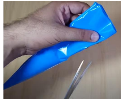
Slika 10 Prepognjeni del