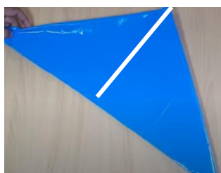
Slika 5 Še 1x prepogni trikotnik