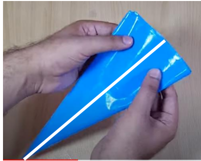
Slika 9 Kako prepognemo