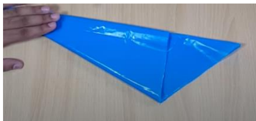
Slika 7 Prepognjeni trikotnik