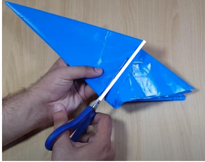
Slika 8 Odrežemo odvečni del