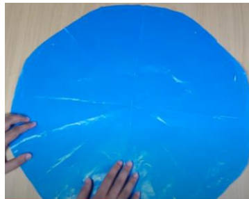
Slika 12 Razgrnemo