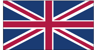
The Union Jack

Danes spet potujemo. In sicer v Britanijo. Ali morda v Anglijo? Kaj pa v Združeno kraljestvo? Toliko imen, le katero bi uporabili, da se ne bomo osmešili.