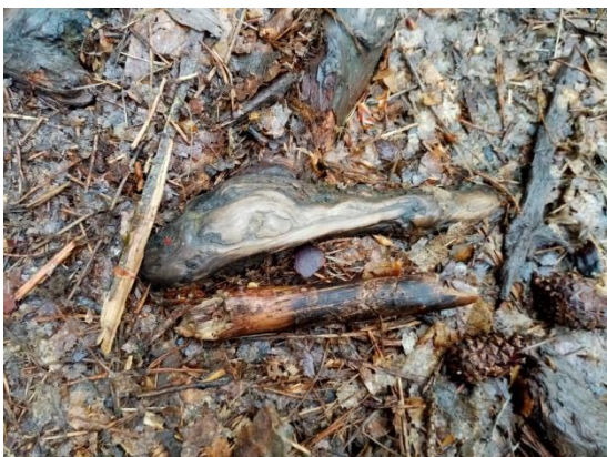
To je fotografija še ene korenine.