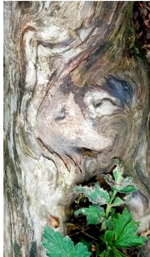
Tukaj je ista fotografija le zasukana za 180° in obrezana na treh robovih.