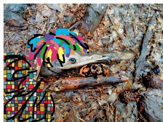
Tu pa je ista fotografija oblikovana na telefonu.

Vsak učenec in učenka pošlje eno fotografijo na naslov barbara.lapuh@guest.arnes.si