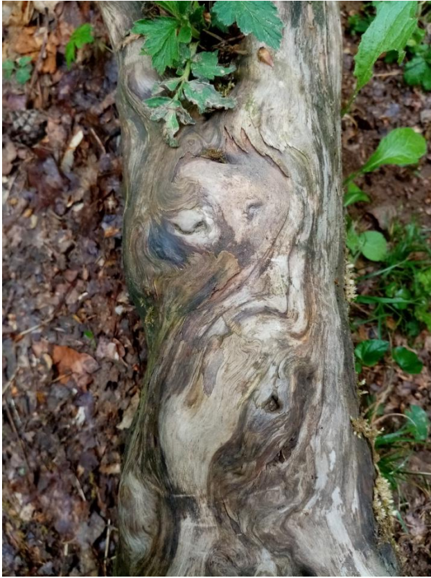
To je fotografija zanimive korenine.

Z vašimi motivi pa se lahko tudi poigravate na različne načine, kot prikazujejo primeri. Pri tem uporabite možnosti za oblikovanje fotografij, ki jih ponujajo vaši pametni telefoni (sukanje, obrezovanje, risanje, dodajanje vzorcev ...) in fotografijo poljubno spremenite.